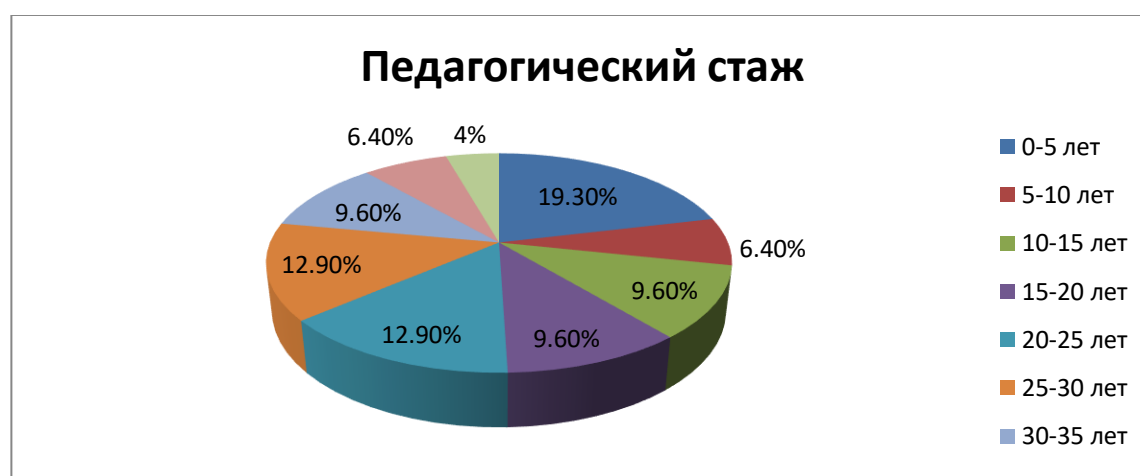
Рисунок 3. Распределение педагогических работников по стажу работы.