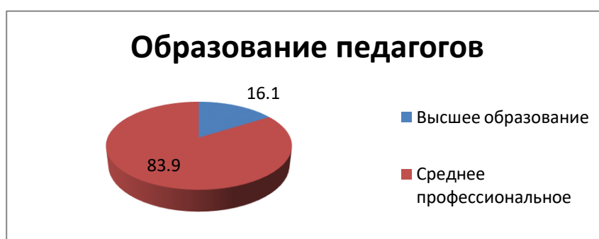
Рисунок 1. Образование педагогов

Высшее педагогическое образование на данный момент получают 2 педагога в ЯГПУ им. К.Д. Ушинского. По результатам проделанного анализа видно, что преобладает количество педагогов со средне-профессиональным образованием.