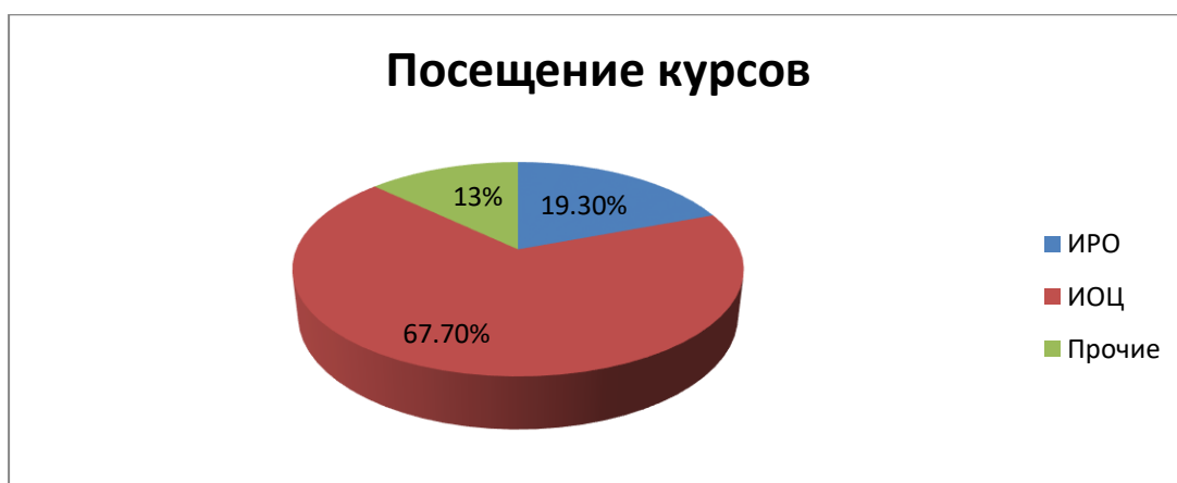
Рисунок.5 Посещение педагогами курсов повышения квалификации.

В связи с внедрением с 2017 года «профессионального стандарта педагога» к воспитателям ДОУ предъявляются определённые требования. В связи с требованиями педагоги должны пройти курсы повышения квалификации по следующим направлениям: